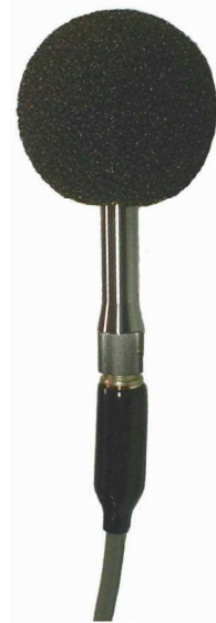
1/2インチ マイクロホン